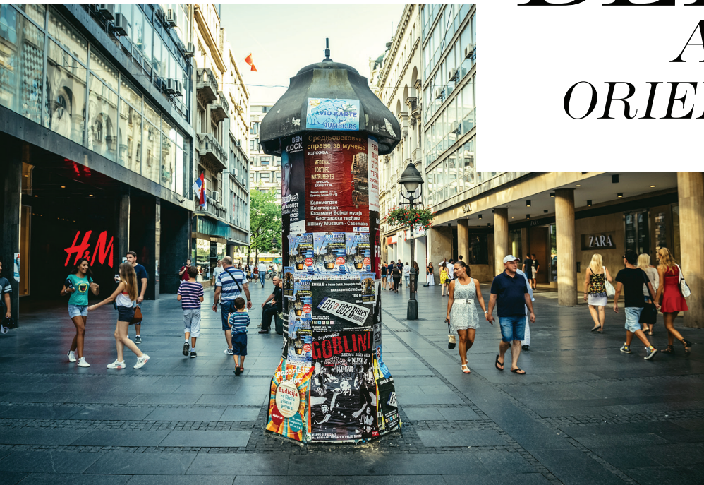
Acima, a rua de pedestres Kneza Mihaila; ao lado, vista da Catedral Ortodoxa sobre o rio Sava. No alto, o forte de Belgrado no Parque Kalemegdan