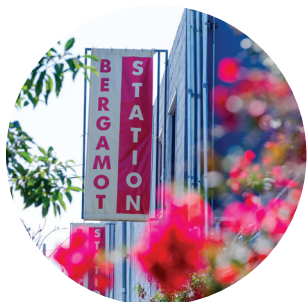
Santa Monica, na Califórnia