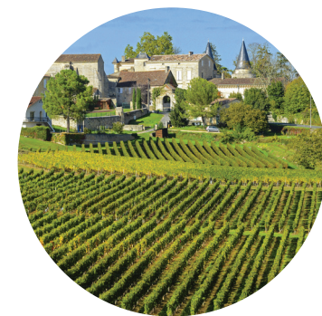
Vinhedos de Saint-Emilion