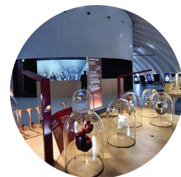
Interior do museu do vinho