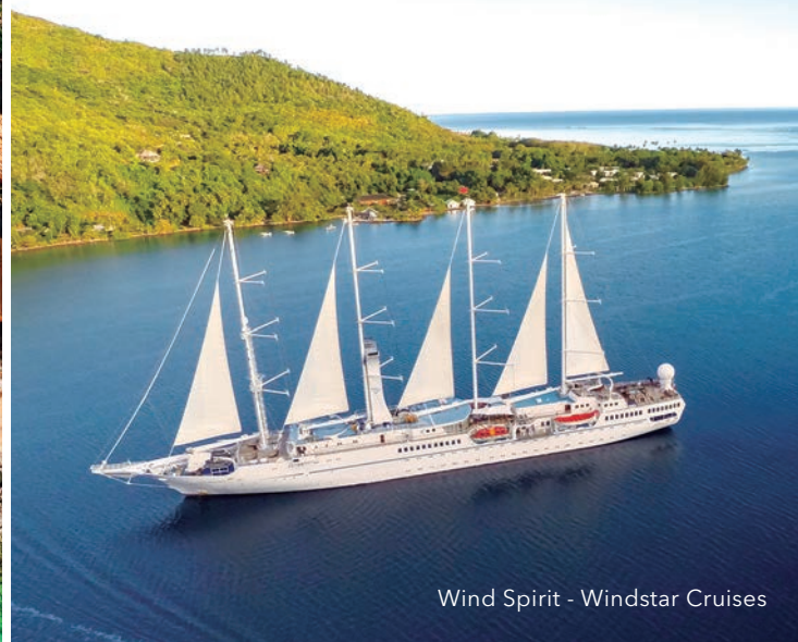
Wind Spirit - Windstar Cruises