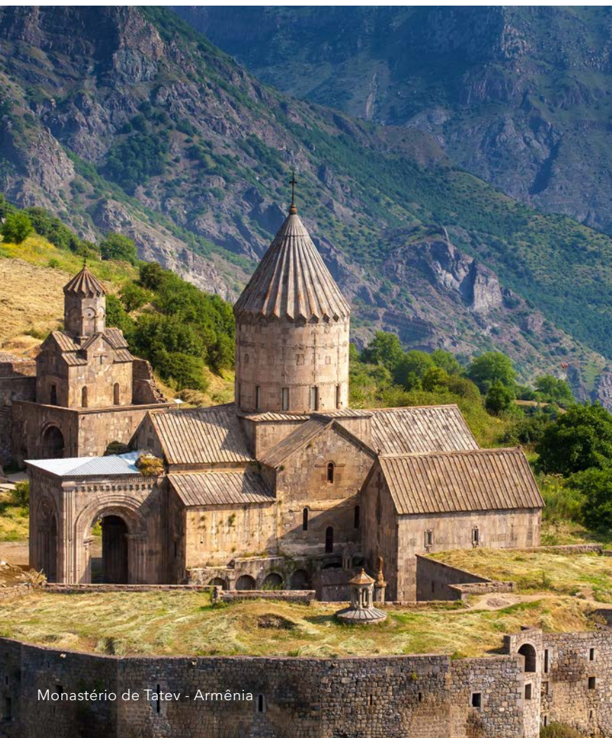
Monastério de Tatev - Armênia