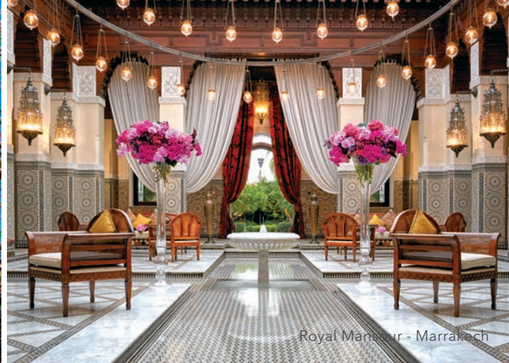
Royal Mansour - Marrakech