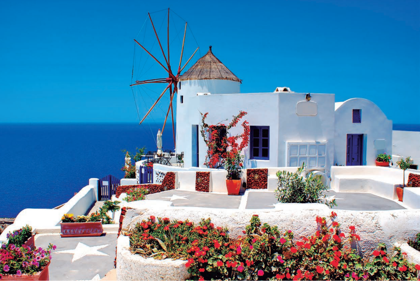
Santorini - Grécia