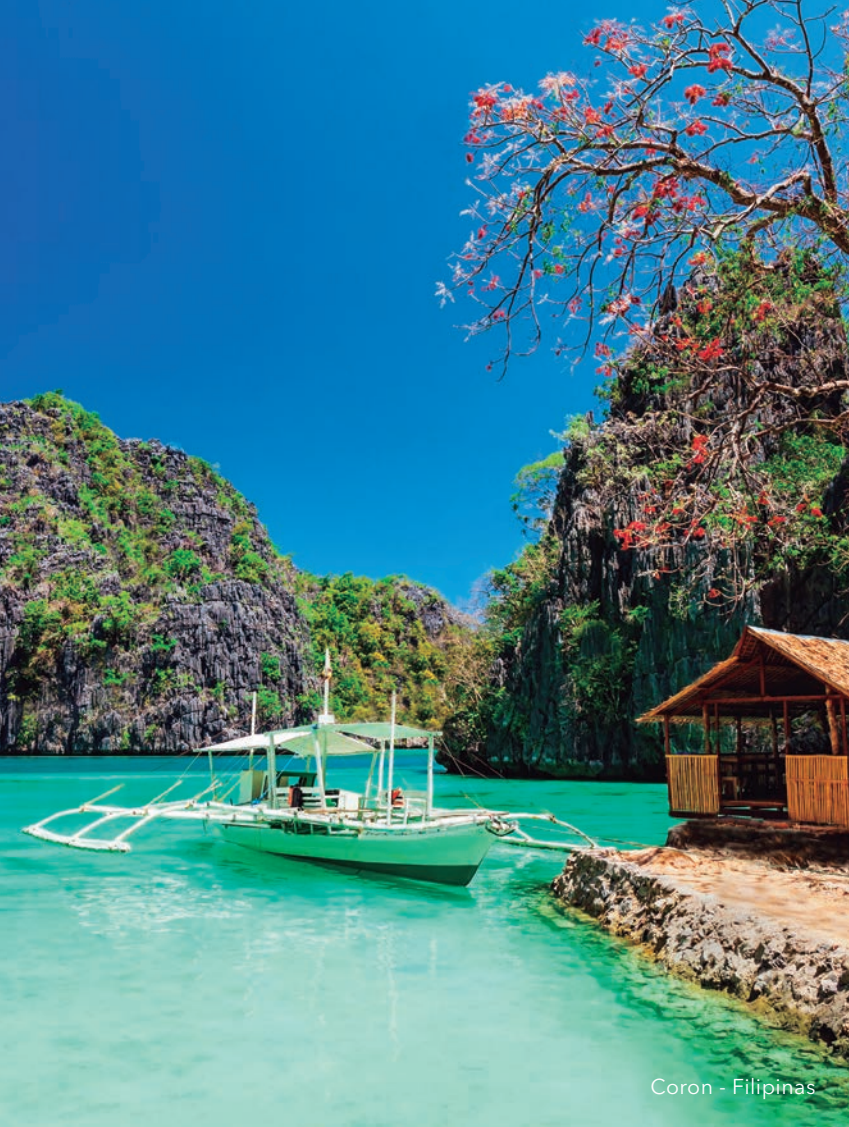
Coron - Filipinas