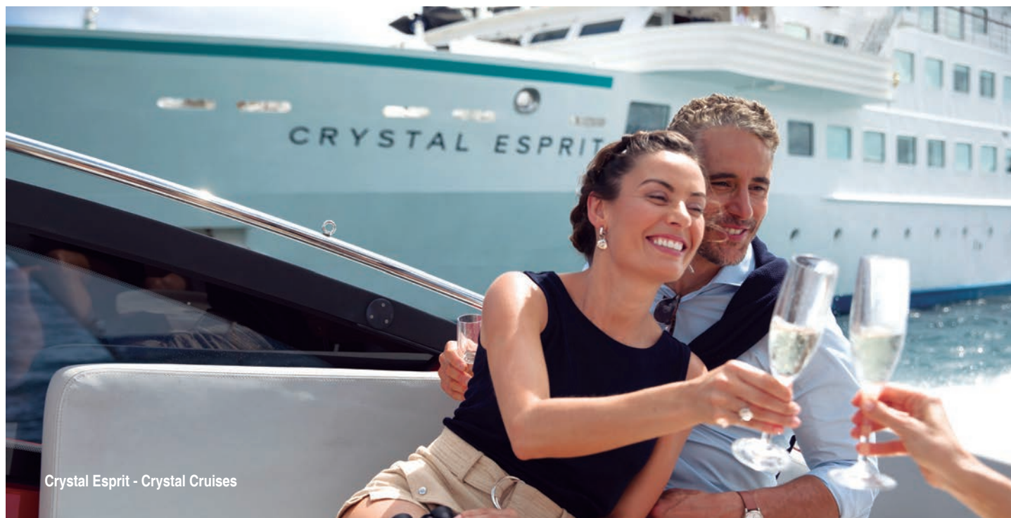
Crystal Esprit - Crystal Cruises

IMPORTANTE: Preços publicados por pessoa em cabine dupla na categoria informada. Não inclui parte aérea e terrestre. Preços correspondentes às datas de saídas mencionadas na validade, não incluem taxas portuárias, governamentais e impostos. Saída com lugares limitados, sujeito a disponibilidade. São os valores mínimos de cada programa convertidos pelo câmbio vigente na data de impressão. Preços em reais serão reconvertidos pelo câmbio turismo na data de pagamento. Disponibilidade e preços sujeitos a alterações sem aviso prévio. Câmbio: US$ 1,00 = R$ 4,26 em 10/09/2019. Imagens meramente ilustrativas.