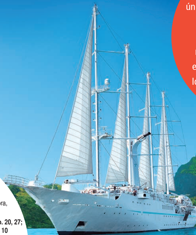
Wind Spirit - Windstar

[ marítimo – Cabine Externa – Cat. B, válido para a saída Ago. 27 ]