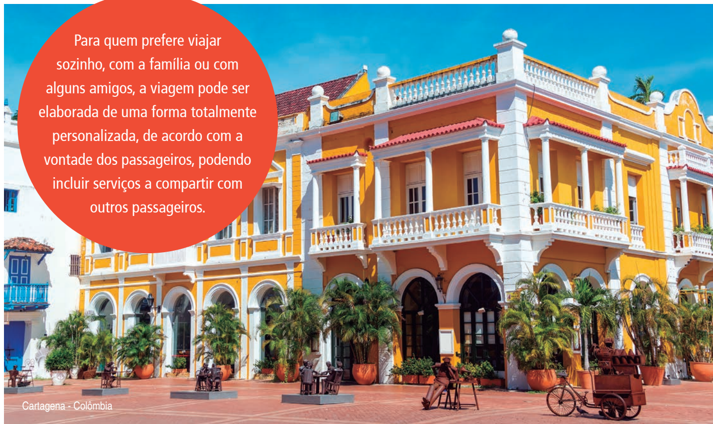
Cartagena - Colômbia

Para quem prefere viajar sozinho, com a família ou com alguns amigos, a viagem pode ser elaborada de uma forma totalmente personalizada, de acordo com a vontade dos passageiros, podendo incluir serviços a compartilhar com outros passageiros.