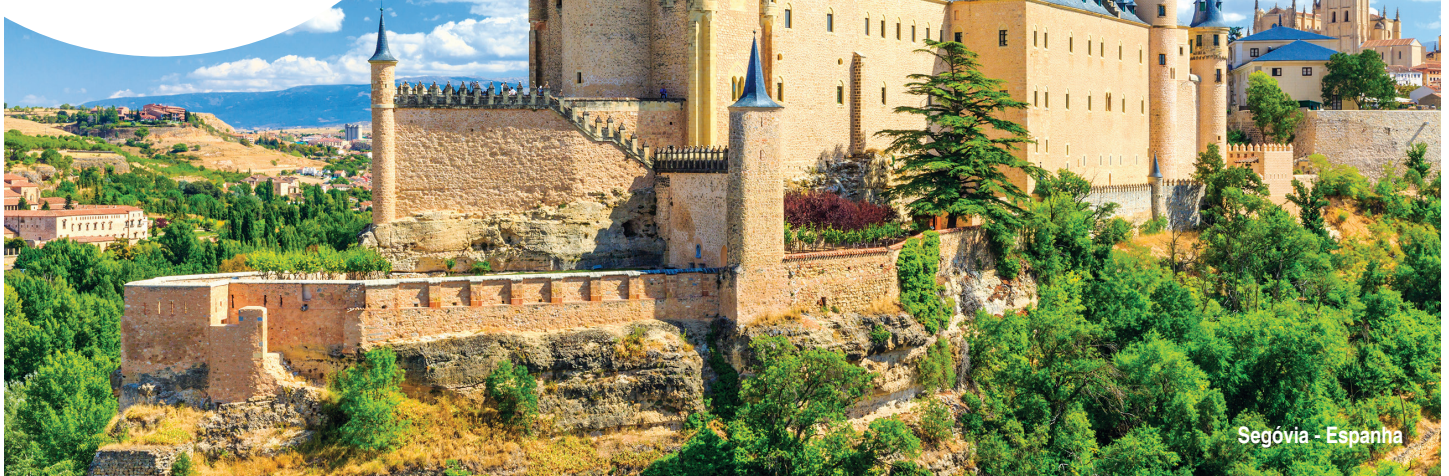
Segóvia - Espanha

[ aéreo + terrestre, válido para saída Ago. 05 ]