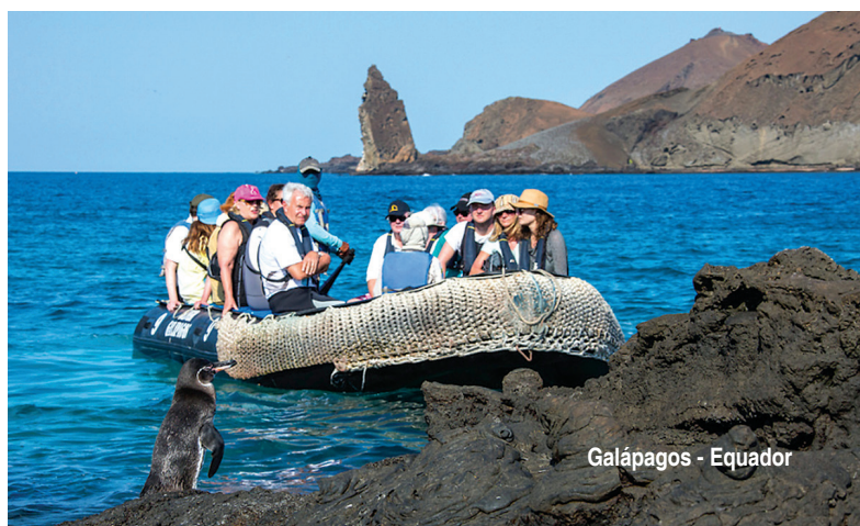
Galápagos - Equador

[ marítimo – Cabine Externa – Cat. ES, válido para a saída Out. 20 ]