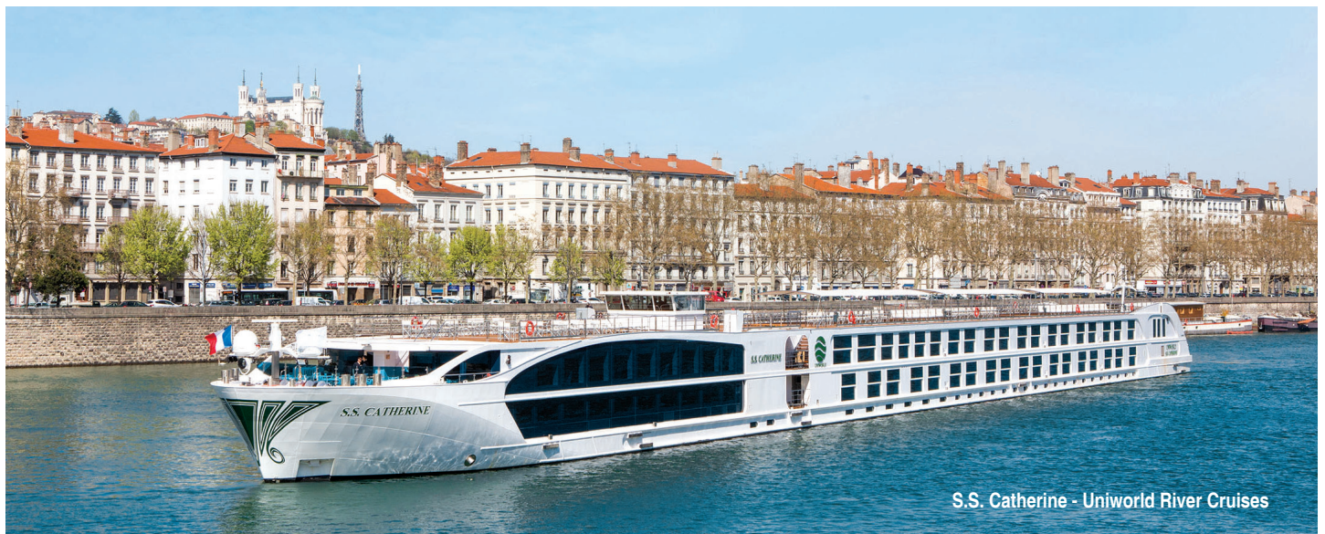
S.S. Catherine - Uniworld River Cruises

[ marítimo – Cabine Externa – Cat. 2, válido para a saída Out. 07 ]