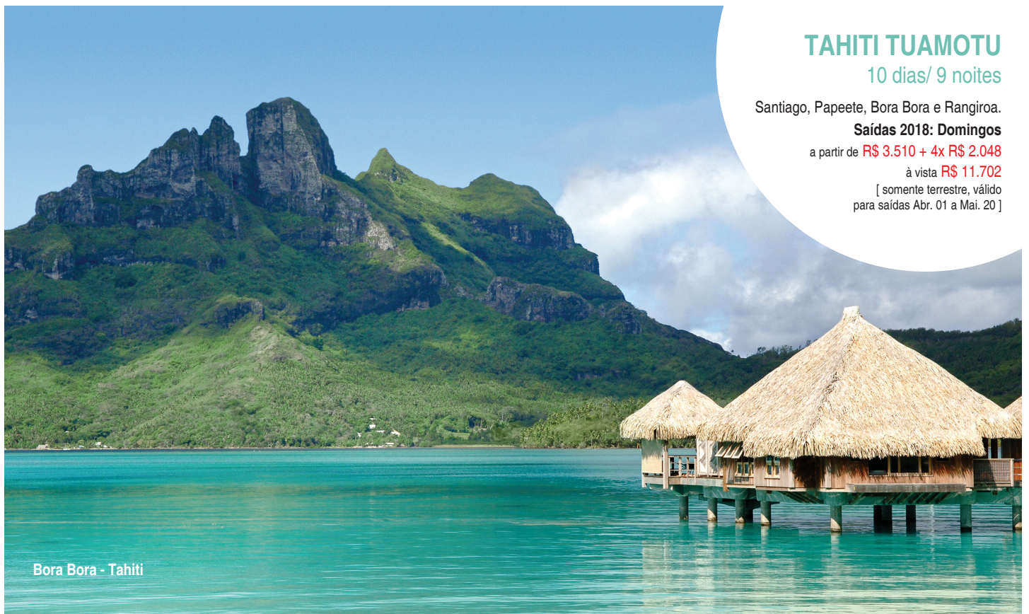
Bora Bora - Tahiti

[ somente terrestre, válido para saídas Abr. 01 a Mai. 20 ]