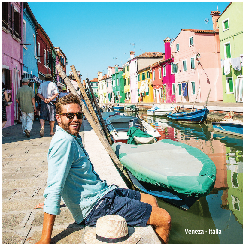
Veneza - Itália

a partir de R$ 1.557 + 8x R$ 778 à vista R$ 7.781 [ somente terrestre ]