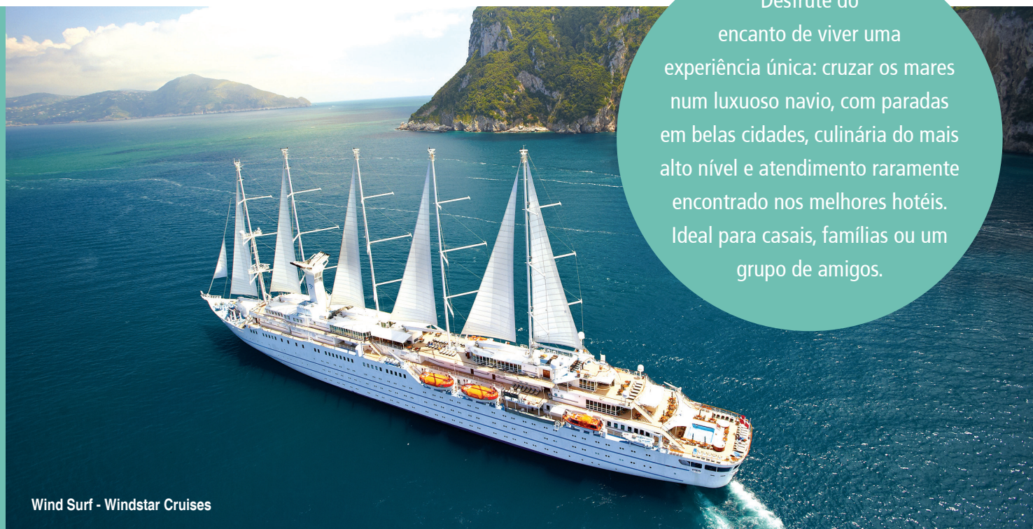
Wind Surf - Windstar Cruises

Desfrute do encanto de viver uma experiência única: cruzar os mares num luxuoso navio, com paradas em belas cidades, culinária do mais alto nível e atendimento raramente encontrado nos melhores hotéis. Ideal para casais, famílias ou um grupo de amigos.