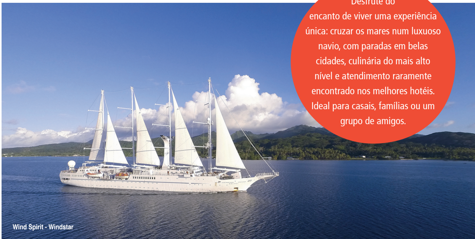
Wind Spirit - Windstar

Desfrute do encanto de viver uma experiência única: cruzar os mares num luxuoso navio, com paradas em belas cidades, culinária do mais alto nível e atendimento raramente encontrado nos melhores hotéis. Ideal para casais, famílias ou um grupo de amigos.