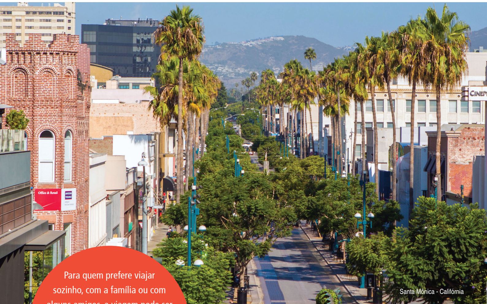
Santa Mônica - Califórnia

Para quem prefere viajar sozinho, com a família ou com alguns amigos, a viagem pode ser elaborada de uma forma totalmente personalizada, de acordo com a vontade dos passageiros, podendo incluir serviços a compartilhar com outros passageiros.