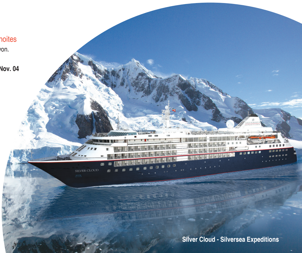
Silver Cloud - Silversea Expeditions

*incluído voo Santiago/Ushuaia/Santiago, 1 noite pré cruise e transfers.