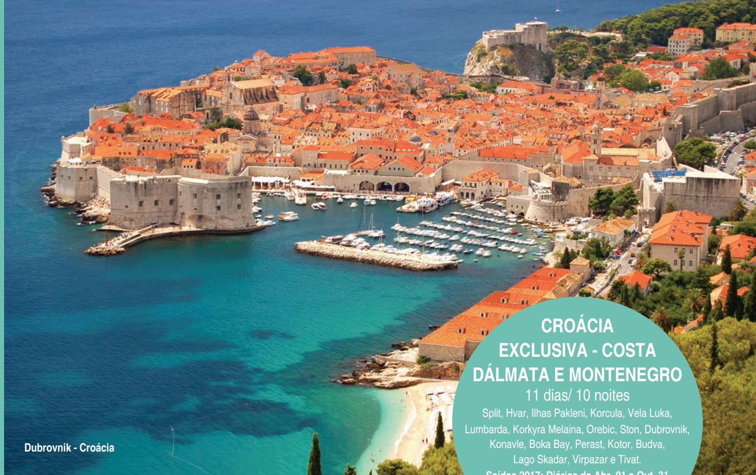
Dubrovnik - Croácia