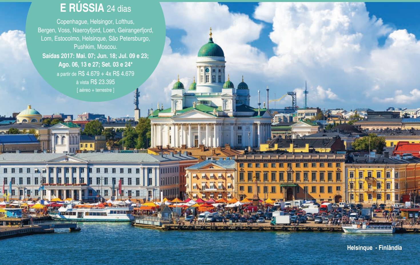
Helsinque - Finlândia

a partir de R$ 4.679 + 4x R$ 4.679 à vista R$ 23.395 [ aéreo + terrestre ]