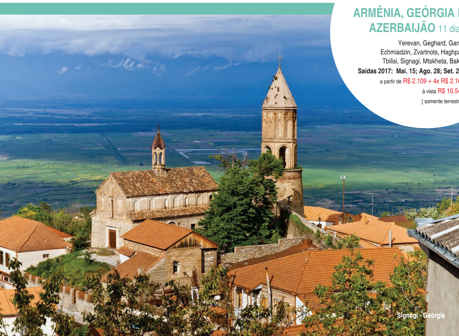
Signagi - Geórgia