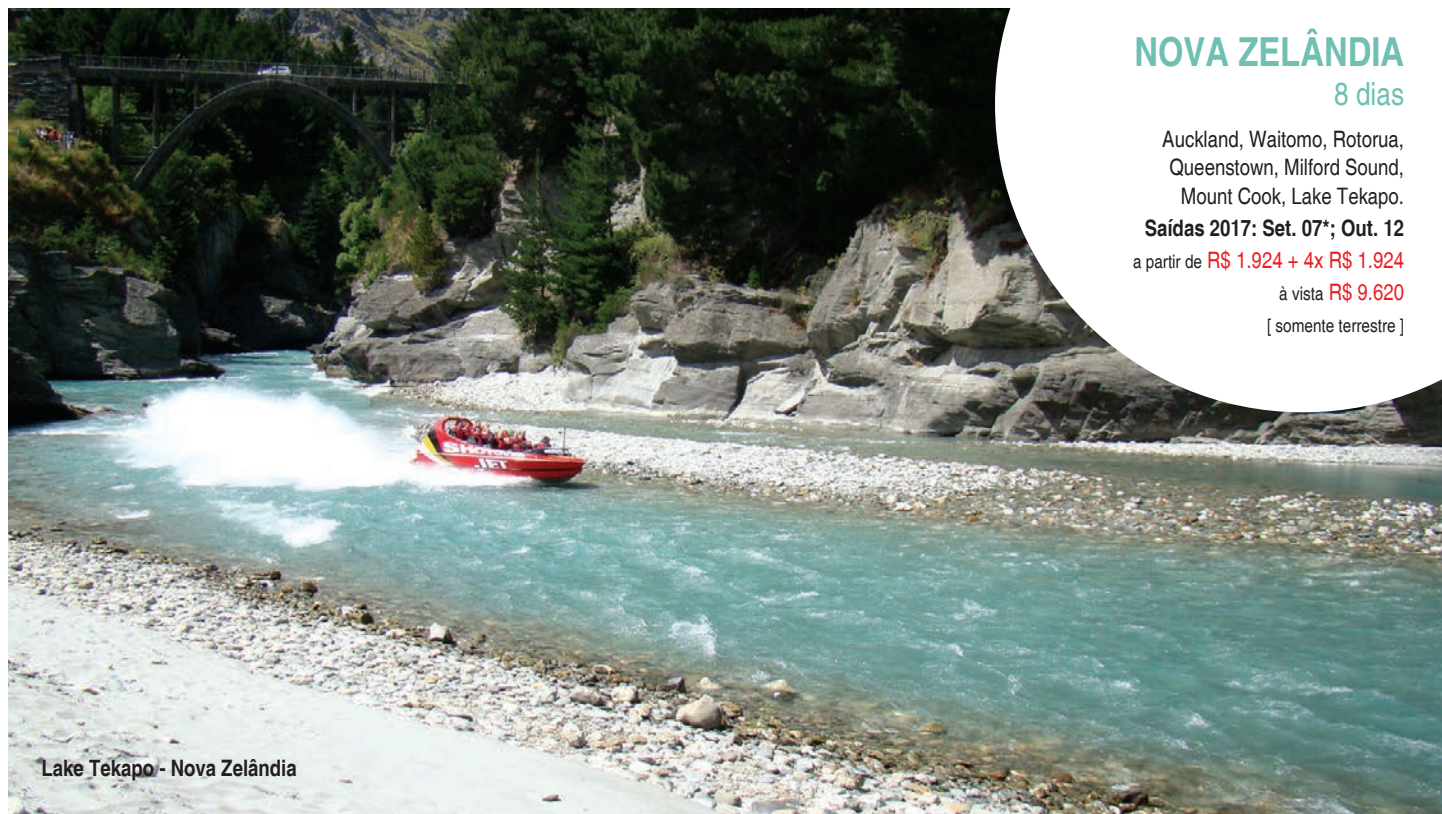
Lake Tekapo - Nova Zelândia

Saídas 2017: Set. 14*; Out. 19 a partir de R$ 1.518 + 4x R$ 1.518 à vista R$ 7.590 [ somente terrestre ]