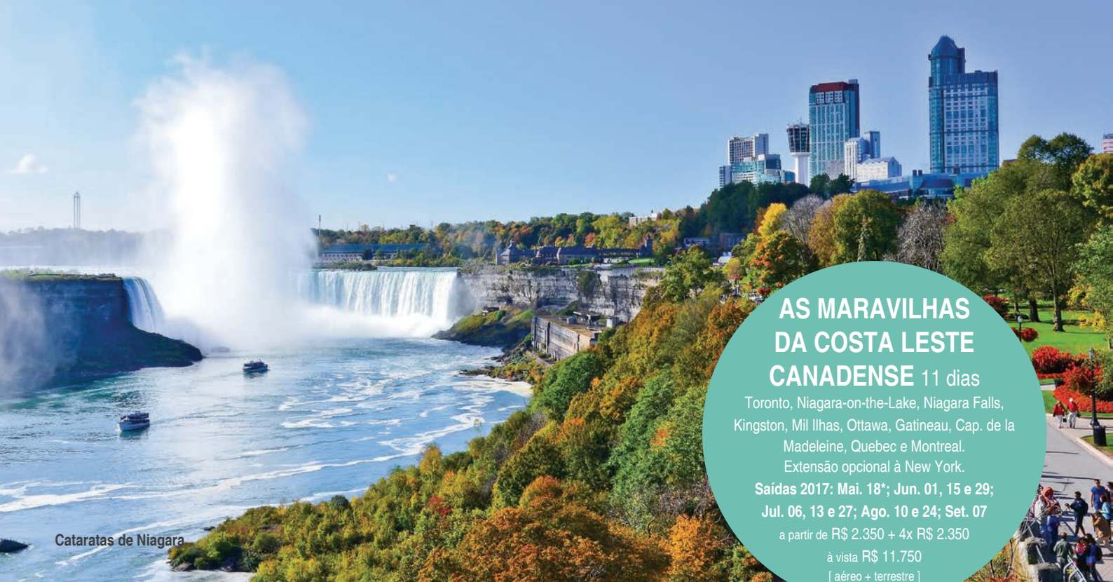
Cataratas de Niagara