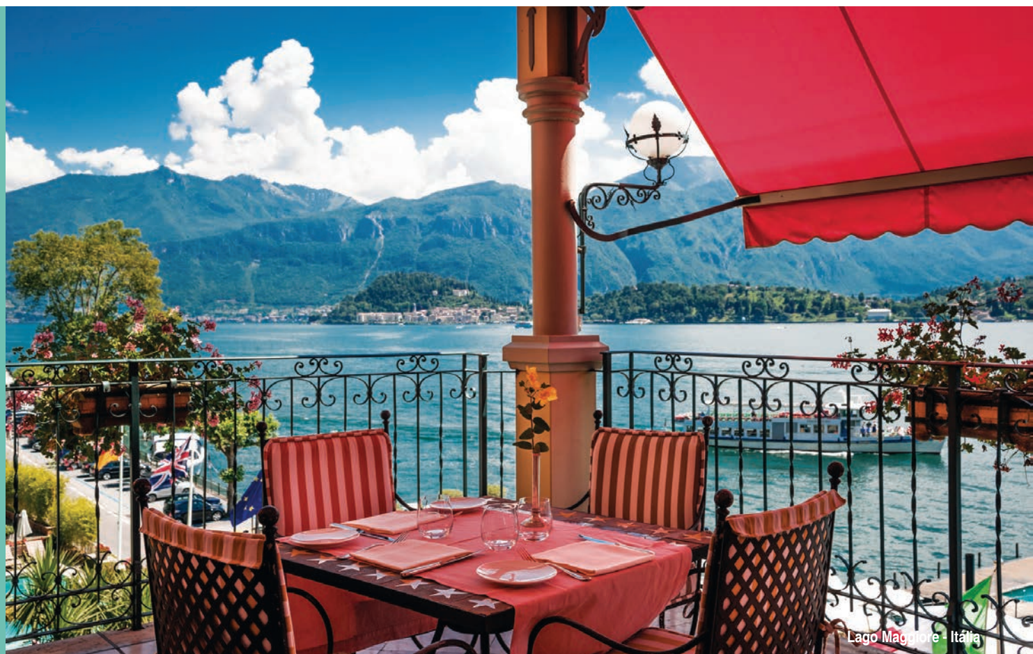
Lago Maggiore - Itália

a partir de R$ 4.242 + 4x R$ 4.242 à vista R$ 21.210 [ somente terrestre ]