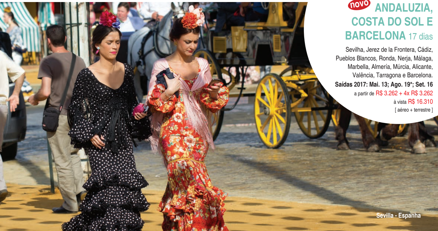
Sevilla - Espanha